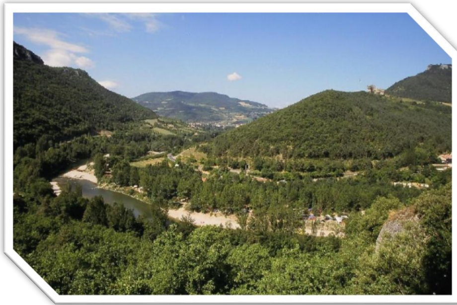
Les Gorges du Tarn