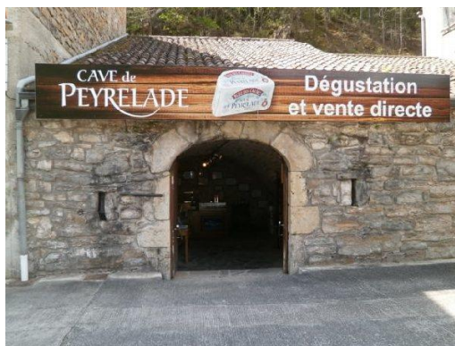
Les Caves de Peyrelade