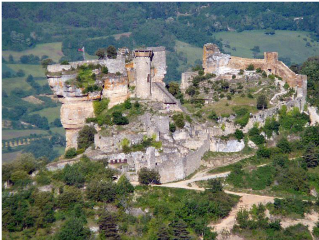
Le Château de Peyrelade

Entre Rivière-sur-Tarn et Le Rozier, un magnifique panorama est à découvrir le long de la vallée. En canoë ou à pied, il est possible d'observer une faune très riche, telle que des vautours ou encore les plus discrets loutres et castors. Cet itinéraire est également une étape du GR736 « Gorges et Vallée du Tarn ».